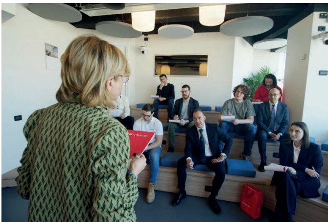
Hack Arena, Cyber & Security Academy, Genova

L'Academy si avvale di un corpo docente costituito da esperti in grado di individuare i contenuti e gli strumenti formativi più adeguati alle esigenze degli utenti (lezioni frontali, in presenza e digitali, video corsi, pillole formative).