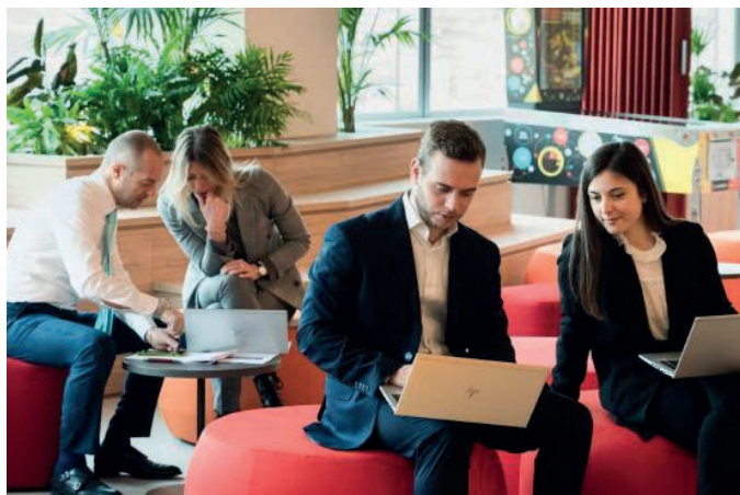
Relax Area, Cyber & Security Academy, Genova

La Cyber & Security Academy di Leonardo si avvale di un'ergonomia dinamica degli spazi che consente la creazione, di ambienti personalizzati per promuovere la condivisione delle informazioni e il lavoro di gruppo. Tutti gli spazi fisici dell'Academy sono progettati anche per supportare la formazione da remoto o in modalità ibrida.