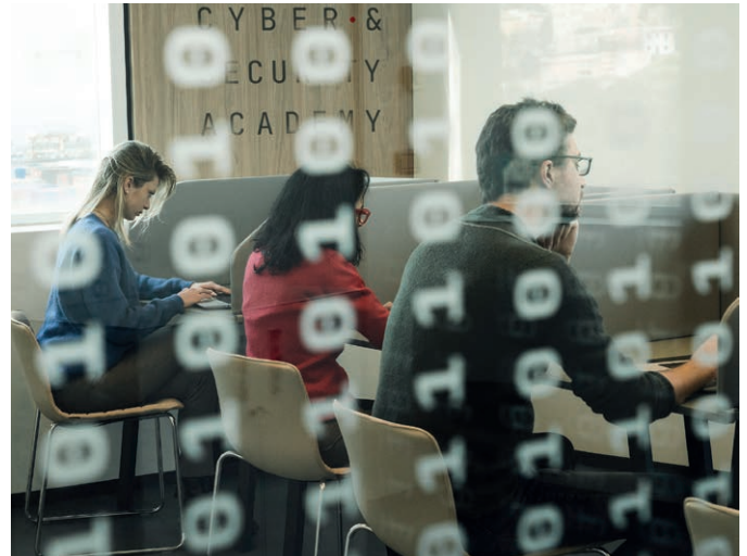
Testing, Cyber & Security Academy, Genova

Il catalogo dell'Academy include percorsi di apprendimento ( Learning Paths ) che identificano i diversi domini di specializzazione che i discenti possono intraprendere nell'ambito dei temi più attuali della global security in termini tecnologici, normativi e di approccio metodologico. Il catalogo include anche un'ampia gamma di corsi su aree tematiche meno verticali che spaziano dallo sviluppo dei soft skill all'acquisizione di competenze sulle tecnologie più utilizzate nell'ambito della sicurezza.